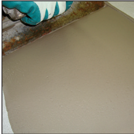
PRO PATCH™ utilisé au-dessus du béton