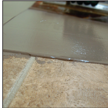
PRO PATCH™ mélangé avec le PRO PATCH LIQUIDE™ et utilisé au-dessus des feuilles de vinyle à endos non coussiné comme produit de nivellement des reliefs